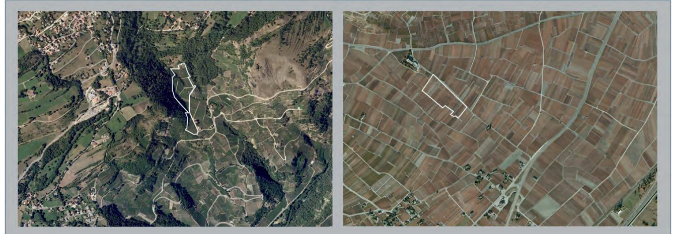
Abb. 2: Links die reich strukturierte Weinbergs-Landschaft oberhalb St. Léonard, rechts die Weinberge von Chamoson (die weiß umrandeten Flächen werden in Abb. 3 dargestellt).

Es ist naheliegend, dass ein Gebiet mit unterschiedlichen Lebensräumen wie Wald, Wiese und Acker mehr verschiedenen Organismen eine Lebensgrundlage bieten kann als eine komplett bewaldete Fläche gleicher Größe. Man darf aber die verschiedenen Biotopfragmente nicht als in sich geschlossene Systeme verstehen. Viele Tierarten, besonders die verhältnismäßig mobilen Vögel, sind auf ein Leben in mehreren Habitat-Typen spezialisiert. So findet zum Beispiel bei manchen Arten die Nahrungssuche nicht in demselben Biotop statt wie die Aufzucht der Jungen. Dies ist einer der Gründe, warum ein kleinräumiges Nebeneinander von Lebensräumen mehr ist, als nur die Summe der einzelnen Fragmente.