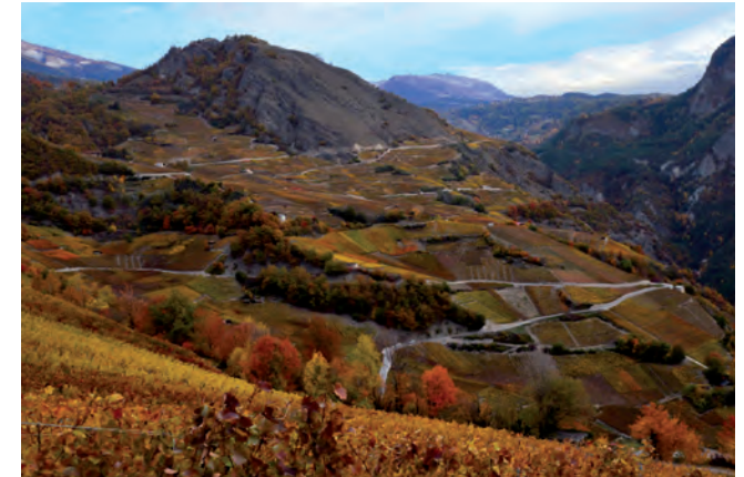
Abb. 1: Die Natur hat also als Dienstleister einen direkten Nutzen und ihre Effizienz hängt von der Biodiversität ab. Je komplexer die Umwelt gestaltet ist, umso höher ist die Biodiversität. Damit also die Ökosystemleistungen optimal ausgeschöpft werden können, ist eine vielfältige Strukturierung des Kulturräumens anzustreben. Blick von den Weinbergen des Delinat-Instituts oberhalb von St. Leonard (Wallis).

Ein aktuelles Beispiel für die Bedeutung der Ökosystemdienstleistungen sind die zahlreichen Erdrutsche und Einstürze von Trockenmauern als Folge der kräftigen Winterniederschläge 2011/2012 in den Walliser Weinbergen. Eine gezielte Begrünung hätte mit ihrem Wurzelwerk den Hang verankern und solche Erosionen verhindern können. Je vielfältiger die Begrünung und dementsprechend die Wurzelstrukturen sind, umso besser ist auch deren Schutzwirkung.